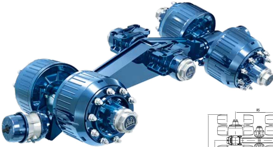
BPW 14 t Tandem-Pendelachse mit der Bremse SN4220