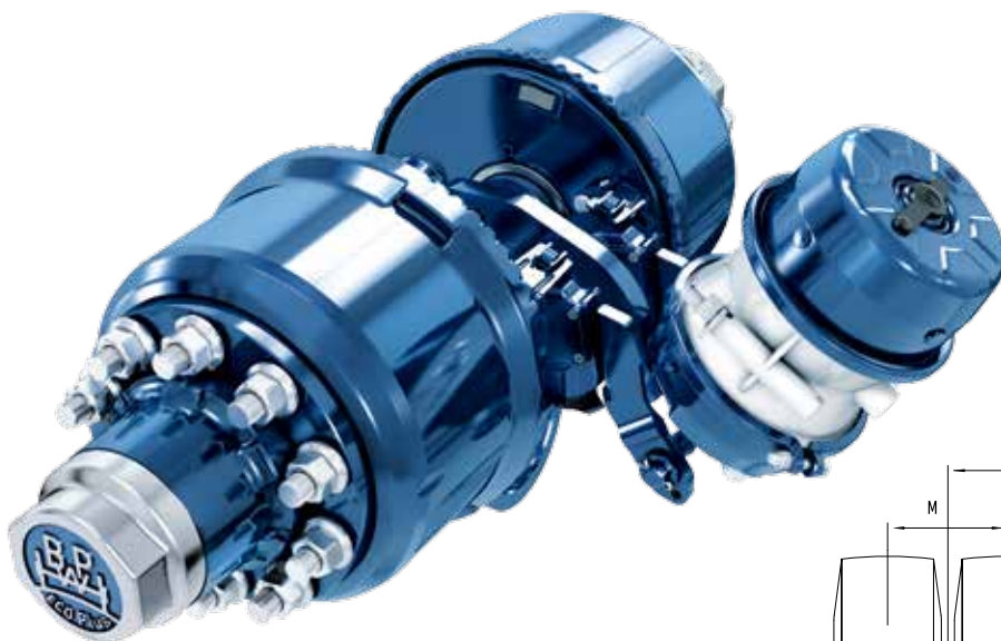
BPW 12 t Pendelachse mit der Bremse SN3015